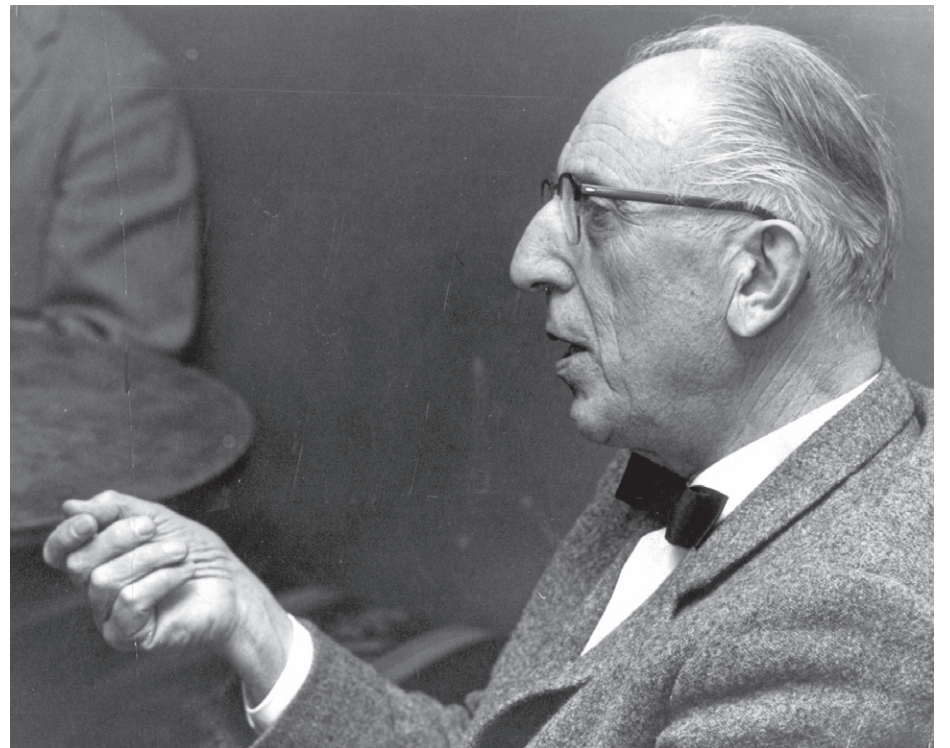
Tonsättaren och dirigenten Hilding Rosenberg skulle kunna vara en person som får sitt namn förevigat, menar Höörs Försköningsförening som nu föreslår en "Walk of Fame".

Föreningen menar att det inte nödvändigtvis behöver vara någon historisk person utan lika gärna en nu levande person som är